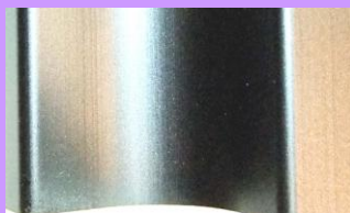
切削面的微粉处理 → 处理后