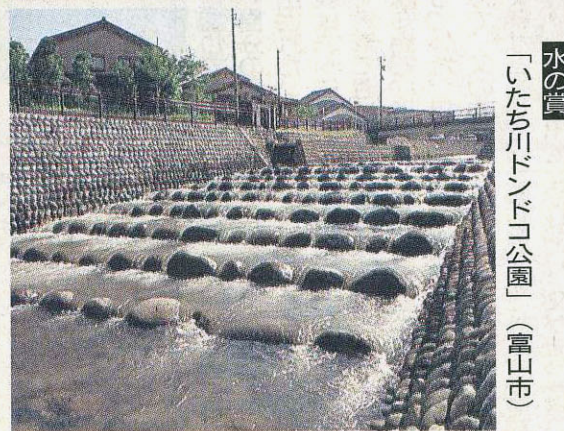
水の賞「いたち川ドンドコ公園」(富山市)

昨年から、建築物に加えて自然環境や景観づくり活動も対象とし、「土・風・水・光・緑」の五つの賞を贈っている。今年、計五十件の応募があり、県景観審議会の選定部会が審査した。「風の賞」に滑川市早月中と協伸静塗社屋(高岡市)、「水の賞」にいたち川ドンドコ公園(富山市)、「光の賞」にたむ2005」に合せて行われる。 が選ばれた。「緑の賞」は該当がなかった。表彰式は十四日、北日本新聞ホールで行われる。「県景観づくりフォーラム2005」に合せて行われる。